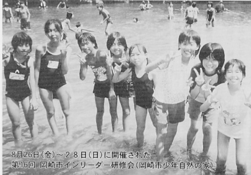
8月26日(金)～28日(日)に開催された 第16回 岡崎市インリーター研修会(岡崎市少年自然の家)

子ども会は、子供の豊かな発 想と多様な個性と人格を認める ことから始まり、指導者の方々 や親は、愛情を持って接するこ とが大事なことだと考えており ます。